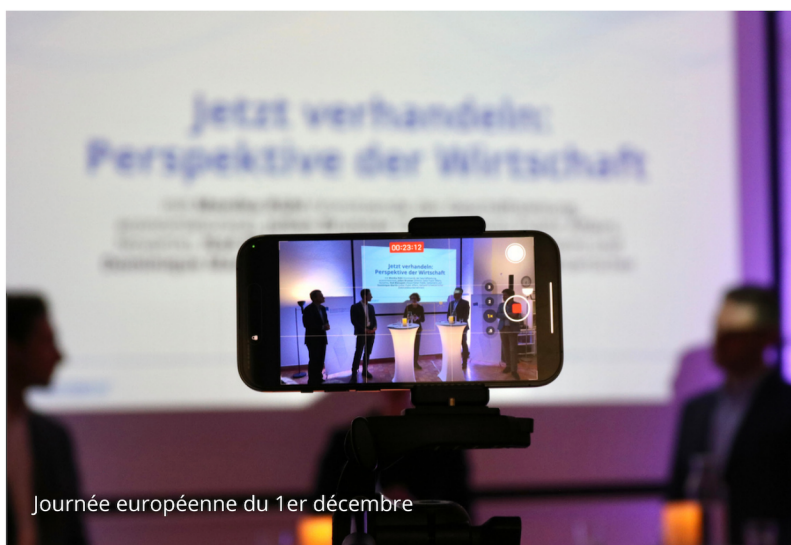
Journée européenne du 1er décembre