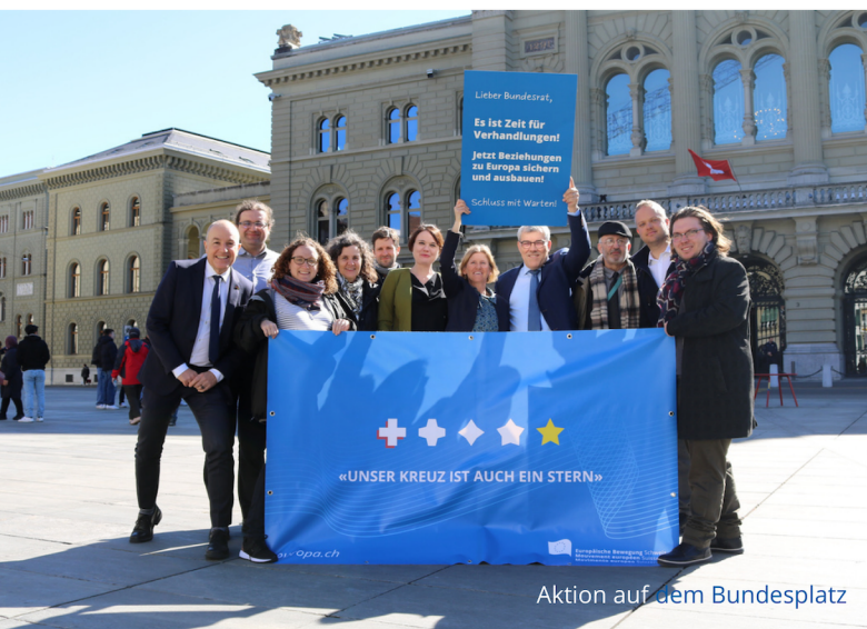
Aktion auf dem Bundesplatz