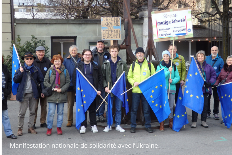
Manifestation nationale de solidarité avec l'Ukraine