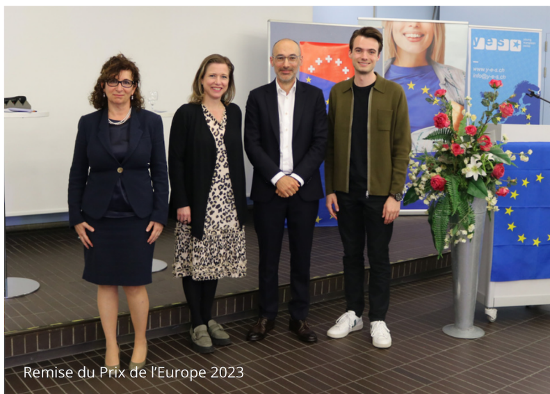
Remise du Prix de l'Europe 2023