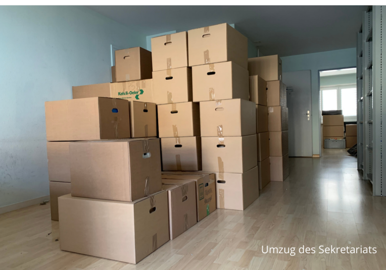
Umzug des Sekretariats