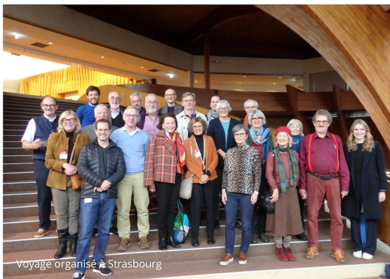
Voyage organisé à Strasbourg