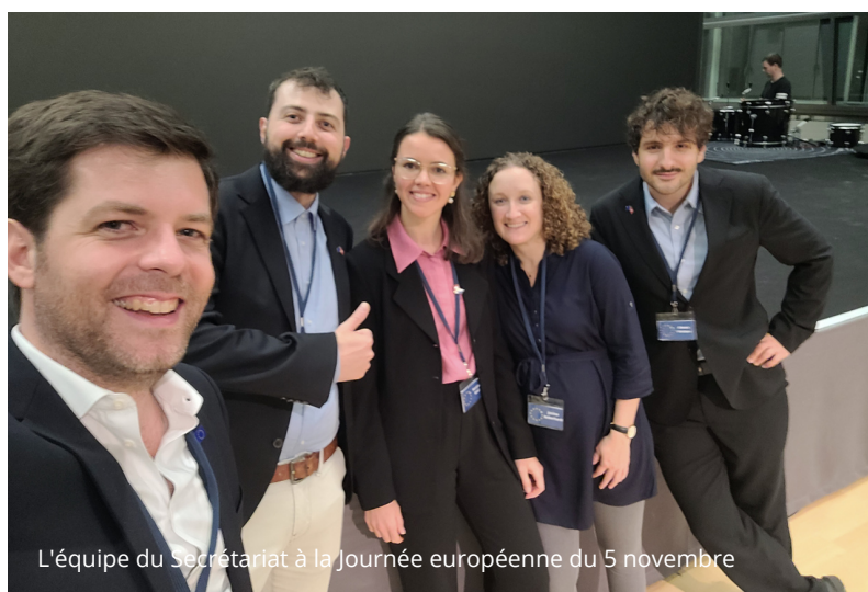
L'équipe du Secrétariat à la Journée européenne du 5 novembre