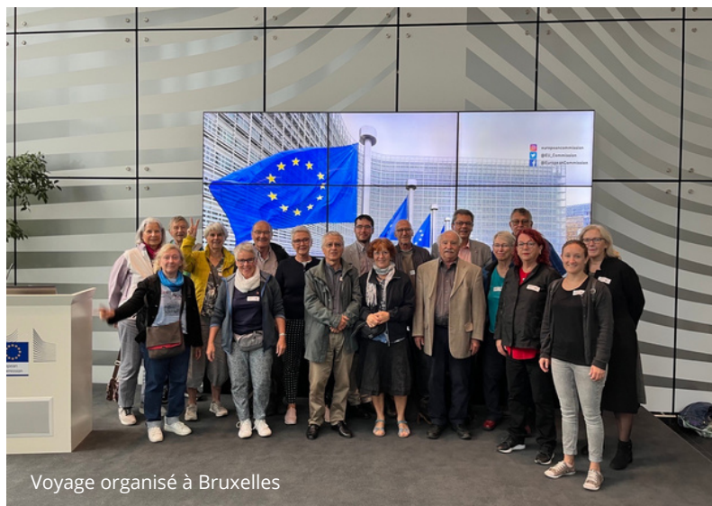
Voyage organisé à Bruxelles