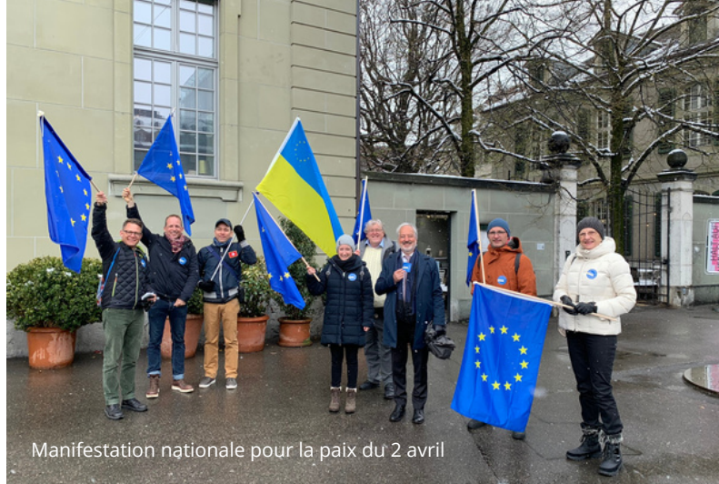
Manifestation nationale pour la paix du 2 avril