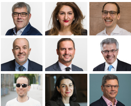
De haut en bas, de gauche à droite / Von oben nach unten, von links nach rechts: