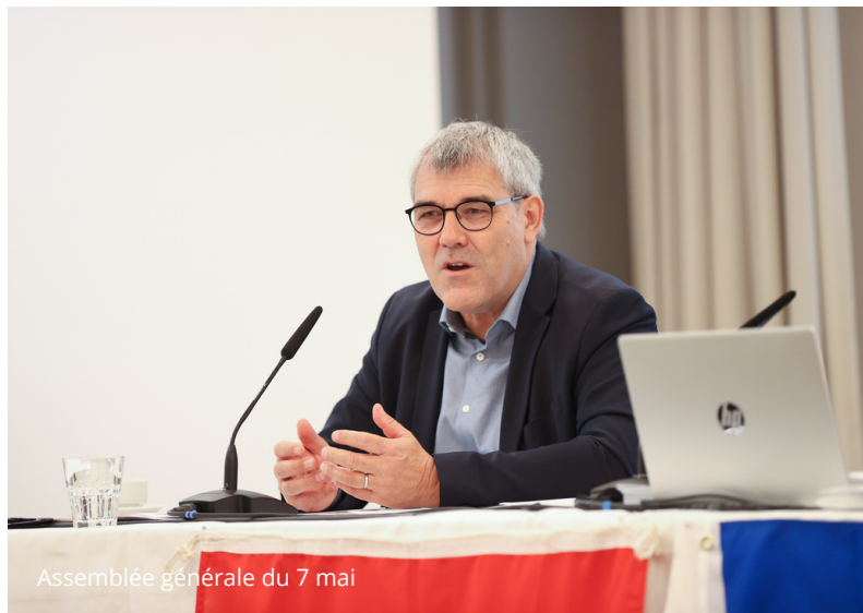
Assemblée générale du 7 mai