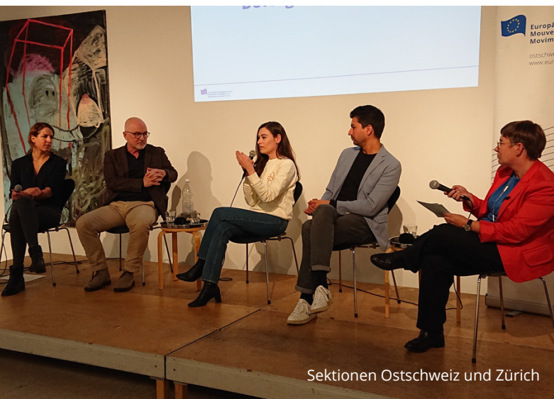
Sektionen Ostschweiz und Zürich