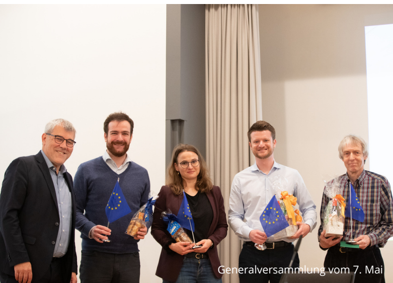
Generalversammlung vom 7. Mai