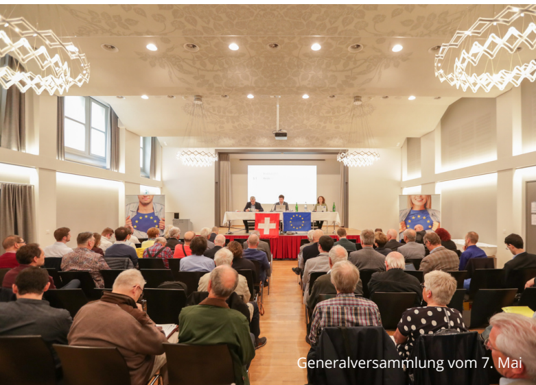
Generalversammlung vom 7. Mai