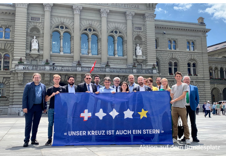
Aktion auf dem Bundesplatz